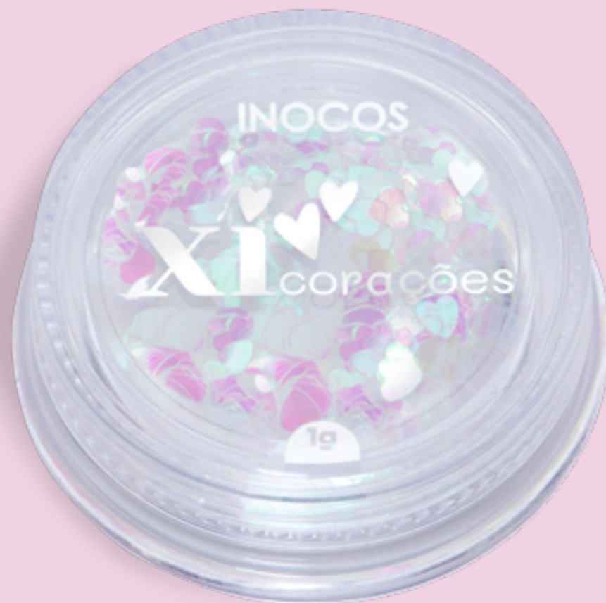
BRANCO HOLOGRÁFICO EN. WHITE HOLOGRAPHIC ES. BLANCO HOLOGRÁFICO FR. BLANC HOLOGRAPHIQUE