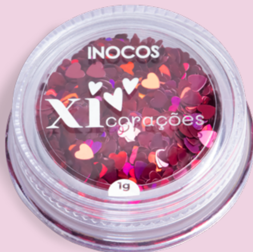
ROSA EN. PINK ES. ROSA FR. ROSE