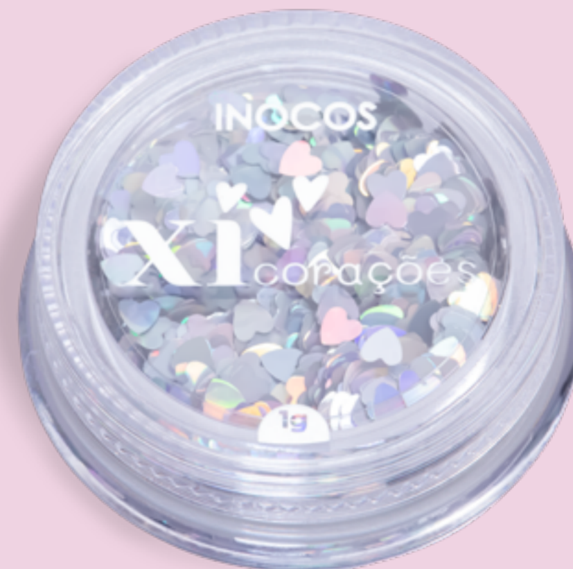
PRATA EN. SILVER ES. PLATA FR. ARGENT