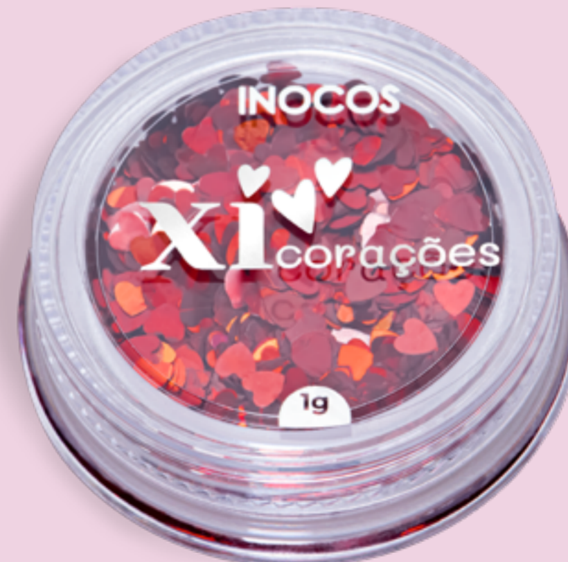
VERMELHO EN. RED ES. ROJO FR. ROUGE