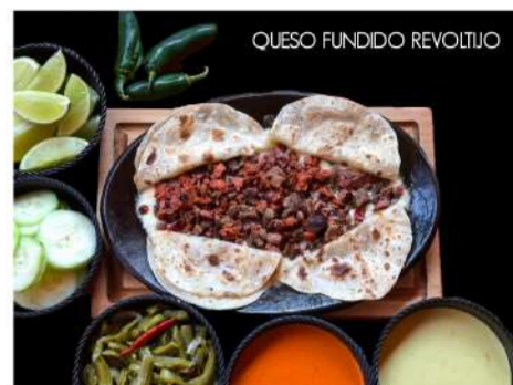
QUESO FUNDIDO REVOLTIJO

FRIJOL CHARROS CAMPECHANOS $40 Con queso y longaniza.