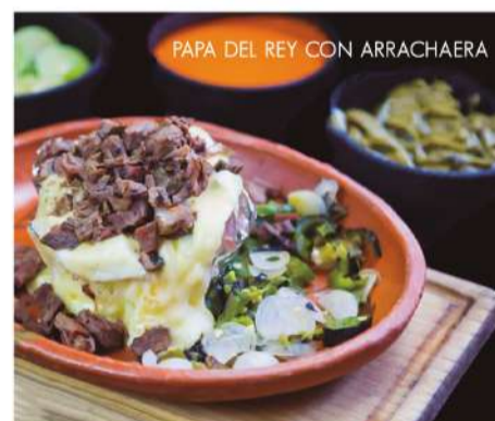
PAPA DEL REY CON ARRACHERA

REVOLTIJO DEL REY $100 Arrachera, bistec, longaniza, salchichón, chistorra y frijoles charros. REVOLTIJO SUPREMO DEL REY $135 Arrachera, bistec, longaniza, salchichón, chistorra, 3 quesadillas y frijoles charros. PAPA DEL REY SENCILLA $ 70 PAPA DEL REY $ 80 LOS NACHOS DEL REY $ 99 CHILAQUILES CON ARRACHERA $ 99 Chilaquiles verdes o rojos con frijoles refritos. Los especiales vienen acompañados de cebollas caramelizadas, queso derretido y aguacate. ESPECIAL DE BISTEC $ 65 ESPECIAL DE ARRACHERA $ 79 ESPECIAL DE SIRLOIN $ 79 BURRITO CON QUESO $ 85 VOLCÁN $ 35