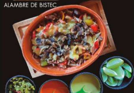
ALAMBRE DE BISTEC