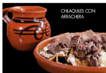
CHILAQUILES CON ARRACHERA

PAN FRANCÉS (3 pzas) · Frutos Rojos con maple $ 80 · Nutella: Acompañado con una bola de helado. $ 95