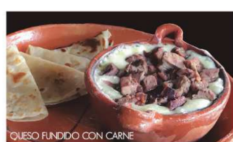
QUESO FUNDIDO CON CARNE

PAN FRANCÉS Acompañado con una bola de helado. · Maple · Nutella