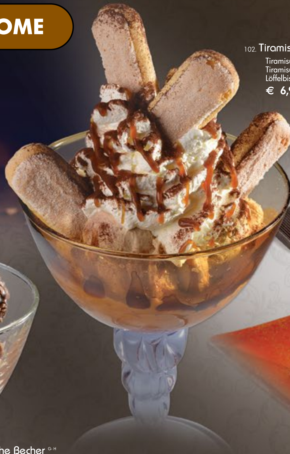
102. Tiramisu Becher A-C-G Tiramisueis, Sahne, Tiramisusoße 2-3 , Löffelbiskuit € 6,90