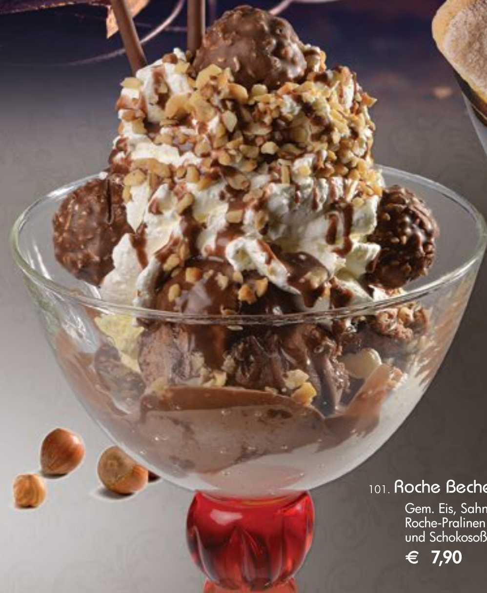
101. Roche Becher G-H Gem. Eis, Sahne, Roche-Pralinen und Schokosoße € 7,90