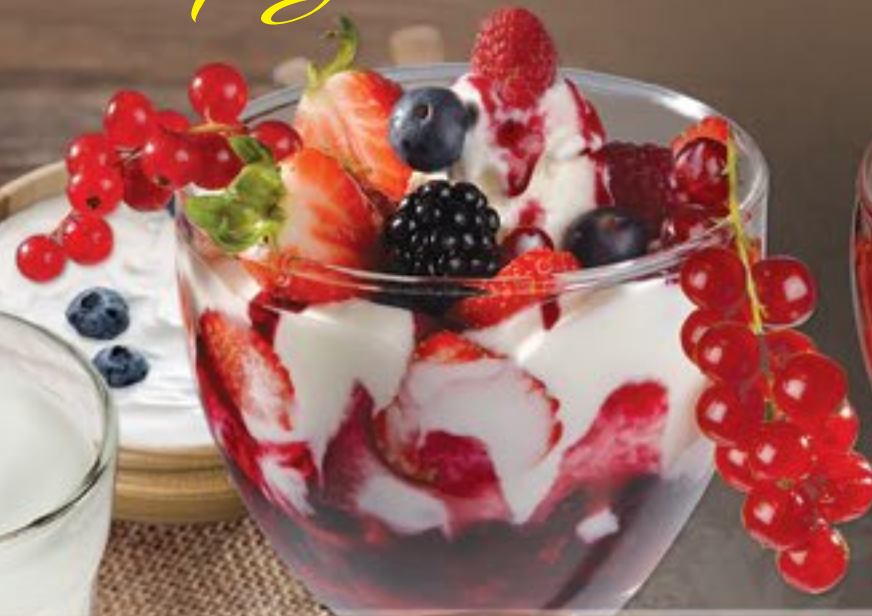
57. Joghurt Waldfrüchte G

Joghurteis, frischer Joghurt, Waldfrüchte und Soße 2-3