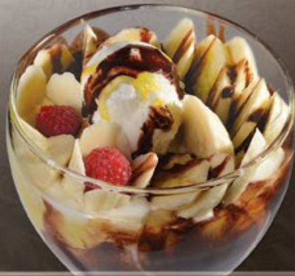
53. Joghurt Banane G

Schokoeis, frischer Joghurt, Banane, Schokoraspel, Schoko- und Bananensoße 2-3