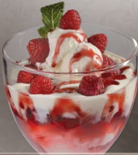
55. Joghurt Himbeer G

Joghurteis, frischer Joghurt, Himbeeren und Himbeersoße 2-3