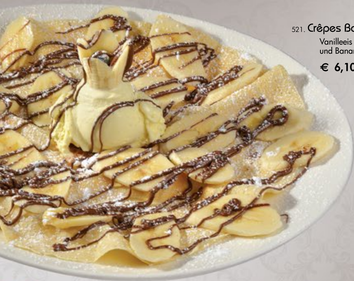
521. Crêpes Banane A-C-G-H

Vanilleeis 2-11 , Nutella und Bananenscheiben