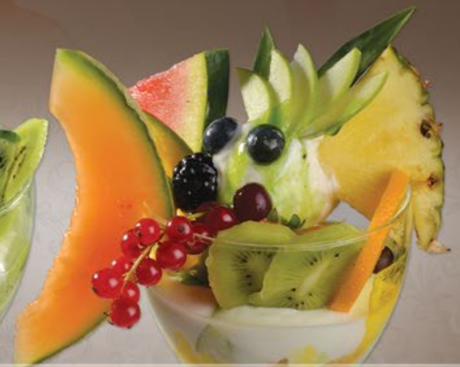
49. Joghurt Früchte G

Joghurteis, frischer Joghurt, gem. Früchte und Soße 2-3