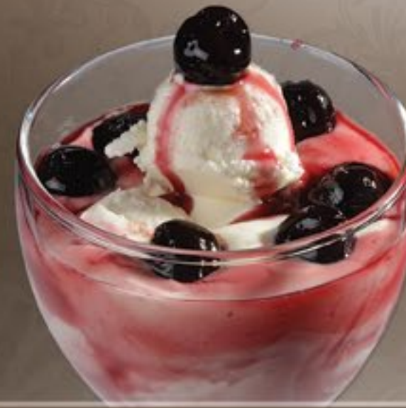
56. Joghurt Amarena G

Joghurteis, frischer Joghurt, Amarenakirschen 2 und Amarenasoße 2-3