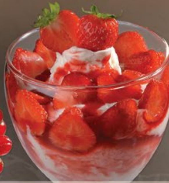
51. Joghurt Erdbeer G

Joghurteis, frischer Joghurt, frischer Erdbeeren und Erdbeersoße 2-3