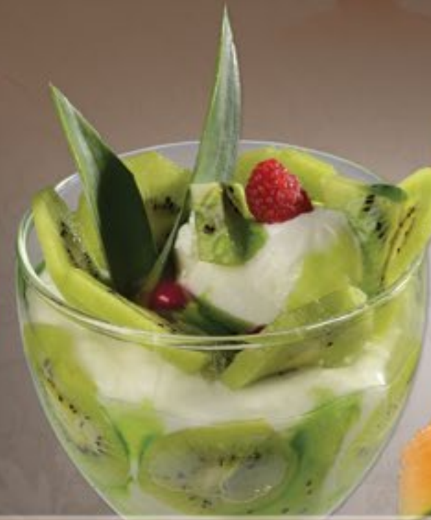
50. Joghurt Kiwi G

Joghurteis, frischer Joghurt, Kiwi und Kiwisoße 2-3