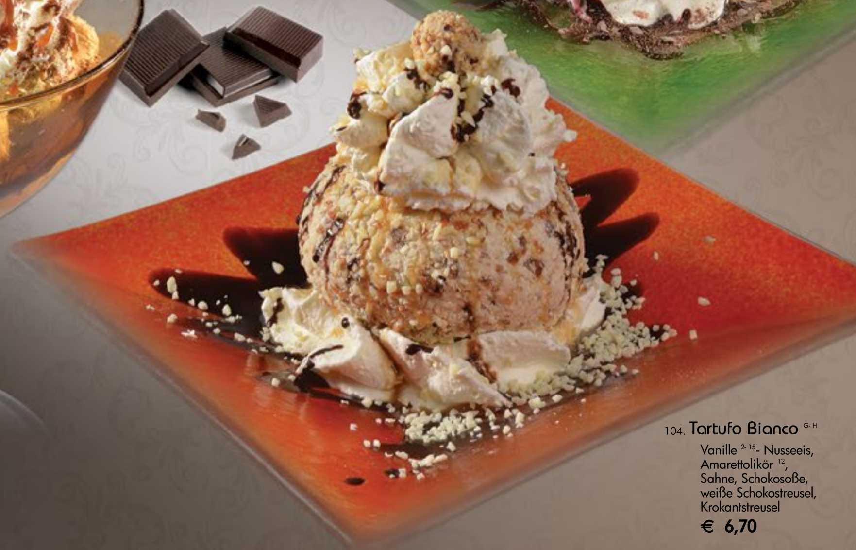
104. Tartufo Bianco G-H Vanille 2-15 - Nusseeis, Amarettolikör 12 , Sahne, Schokosoße, weiße Schokostreusel, Krokantstreusel € 6,70