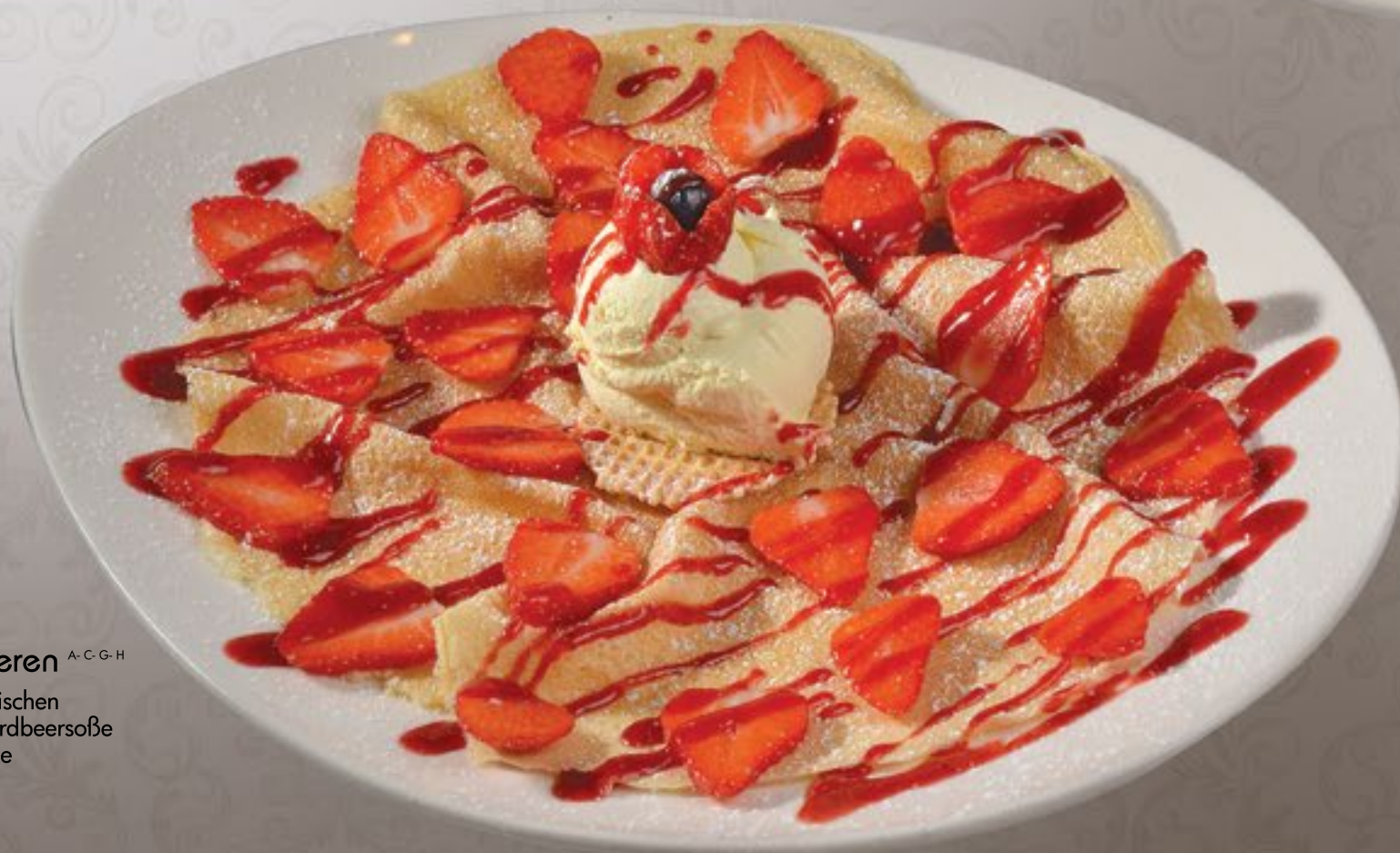
519. Crêpes Erdbeeren A-C-G-H

Vanilleeis 2-11 , frischen Erdbeeren mit Erdbeersoße oder Nutellasoße