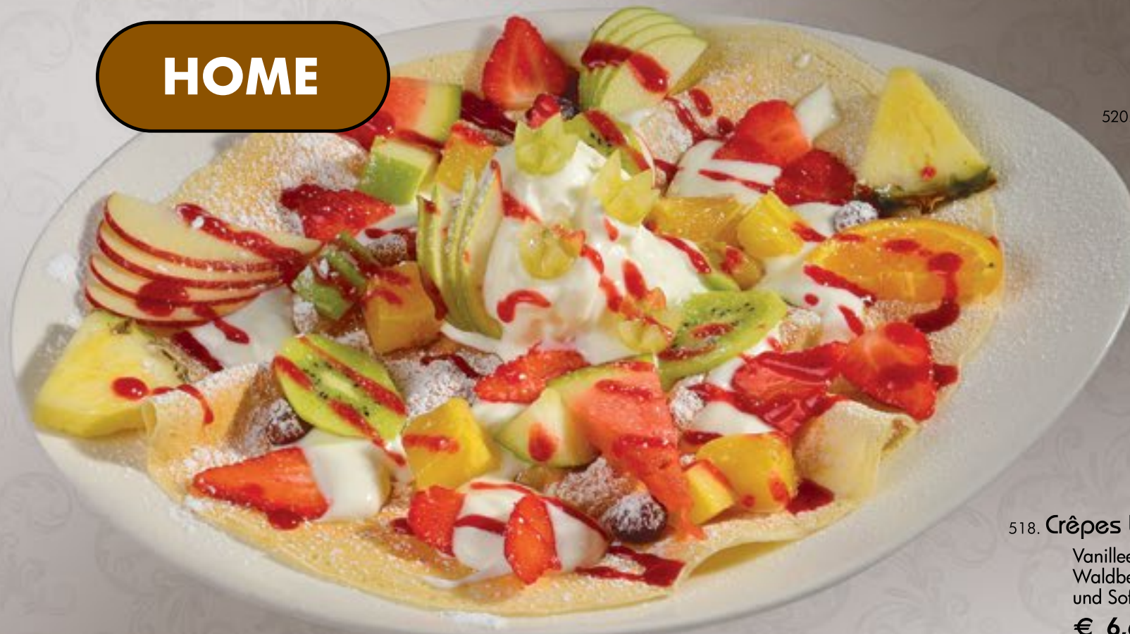
520. Crêpes Joghurt A-C-G

Joghurteis, frischer Joghurt, frischen Obstsalat und Erdbeersoße