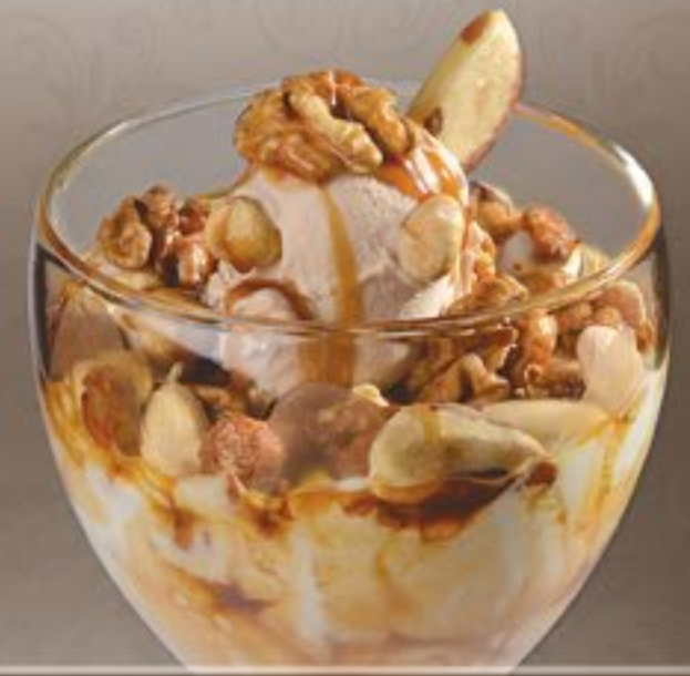
52. Joghurt Nüsse G-H

Nusseis, frischer Joghurt, gem. Nusskrokant (Haselnüsse und Mandeln) und Nusssoße 2-3