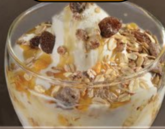
54. Joghurt Müsli G-H

Joghurteis, frischer Joghurt, Müsli und Honig