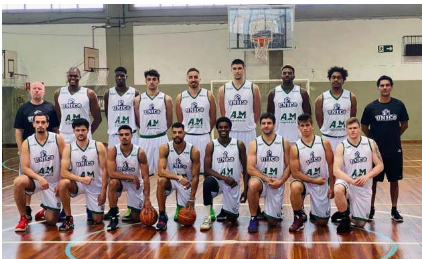
UniCo usou o Estadual de 2020 como laboratório para o Brasileirão da CBB