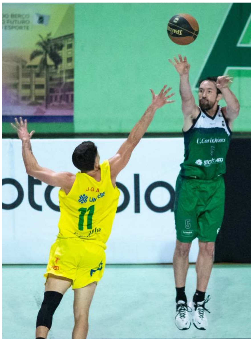
Cafferata liderou o time na estreia do Brasileirão da CBB