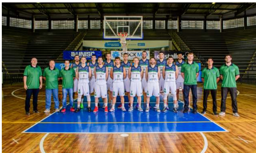
Elenco do Stock Med/União Corinthians que disputou o Brasileirão da CBB