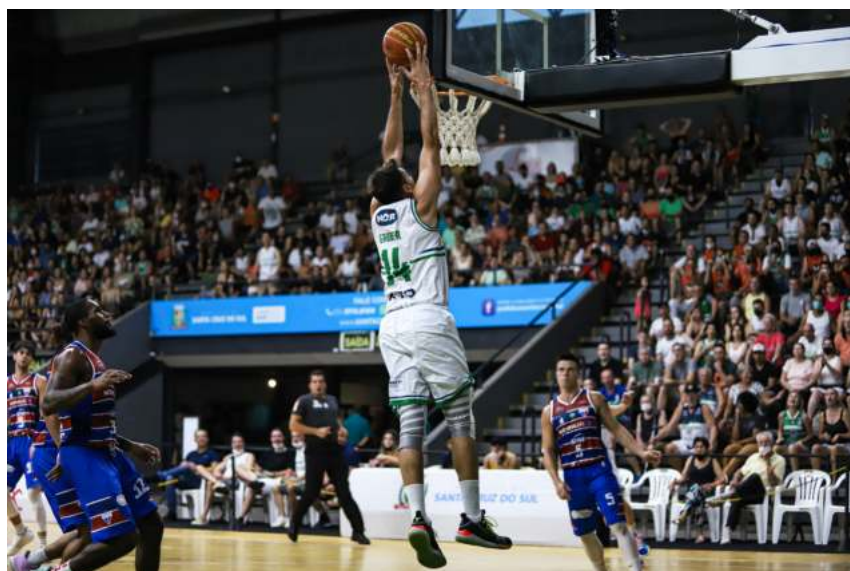
Gruber enterra durante jogo do retorno do NBB