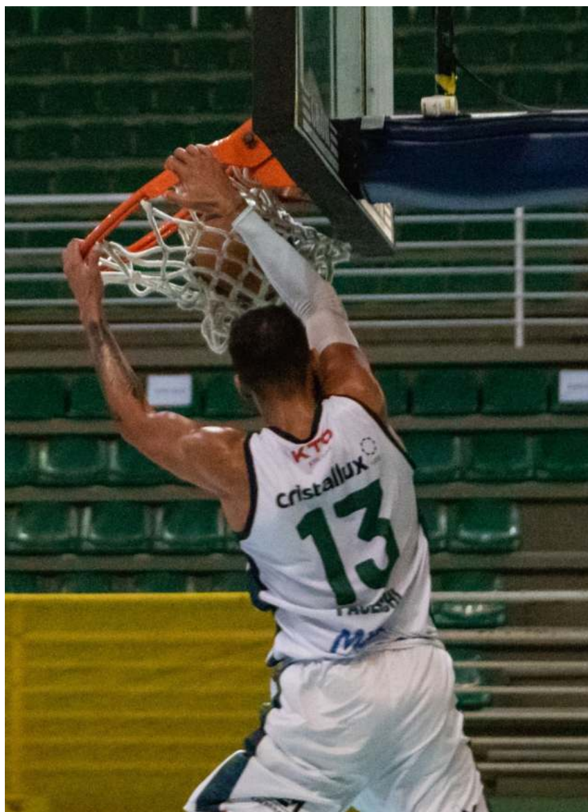
Paulichi distribuiu enterradas ao longo do Brasileirão da CBB