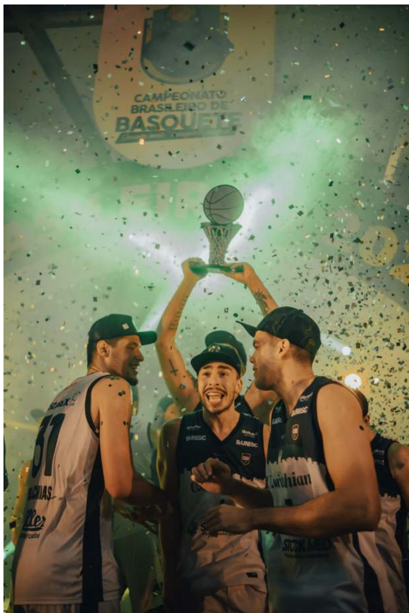
União Corinthians comemorou em Santa Catarina o título nacional