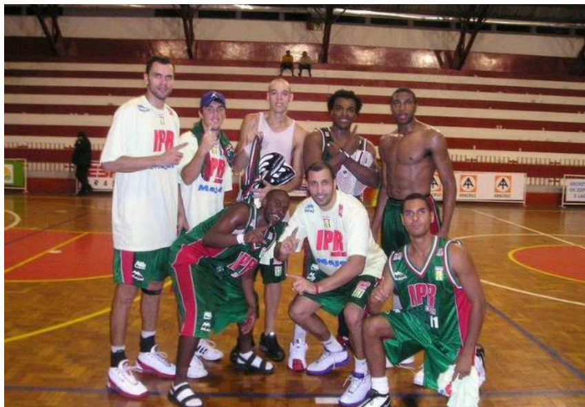
Athos (11) integrou o elenco do IPR/Corinthians