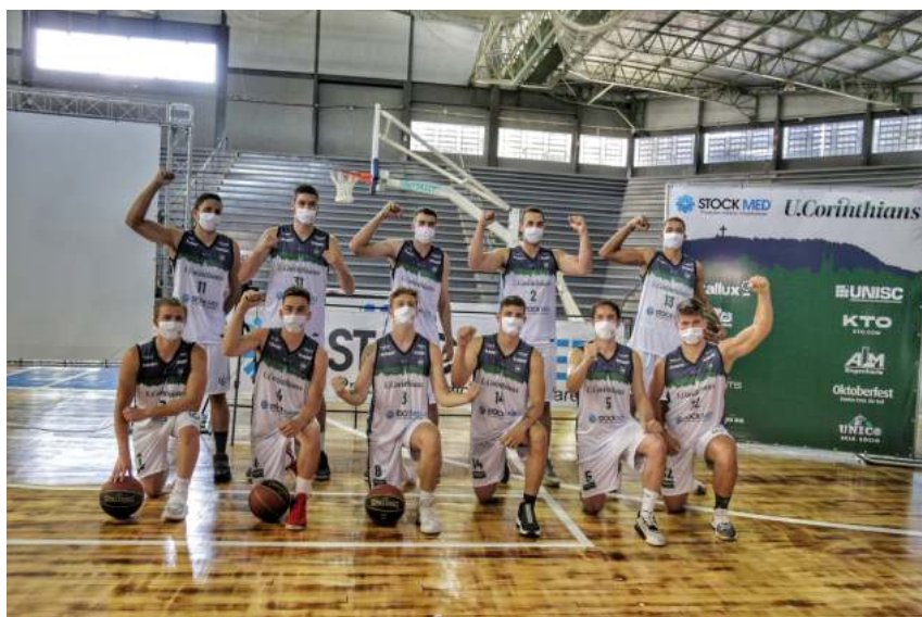
UniCo retornou ao cenário do basquete nacional em meio à pandemia de Covid-19