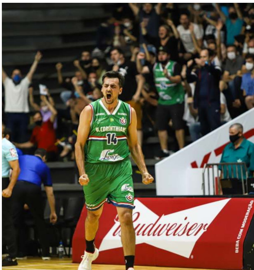
Gruber extravasa. Retorno de jogo histórico no Arnão