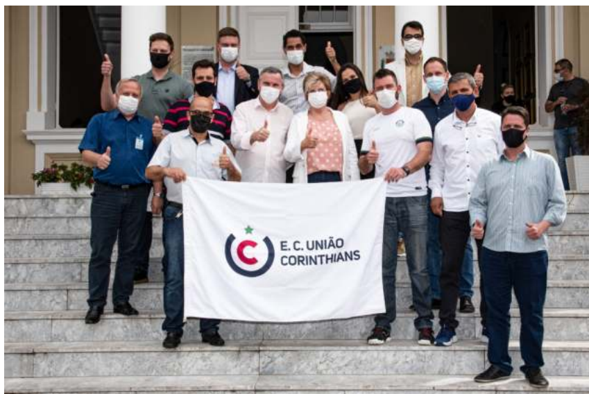
Clube, patrocinadores e prefeitura se uniram para viabilizar a volta à elite