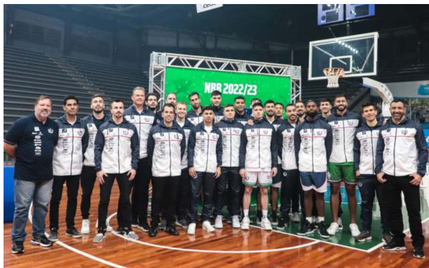
União Corinthians manteve Santa Cruz na elite na temporada 2022-2023