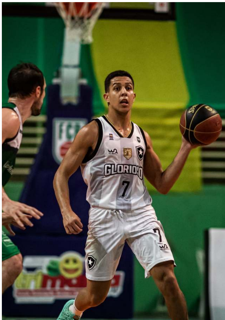
União Corinthians superou o Botafogo na semifinal do Brasileirão