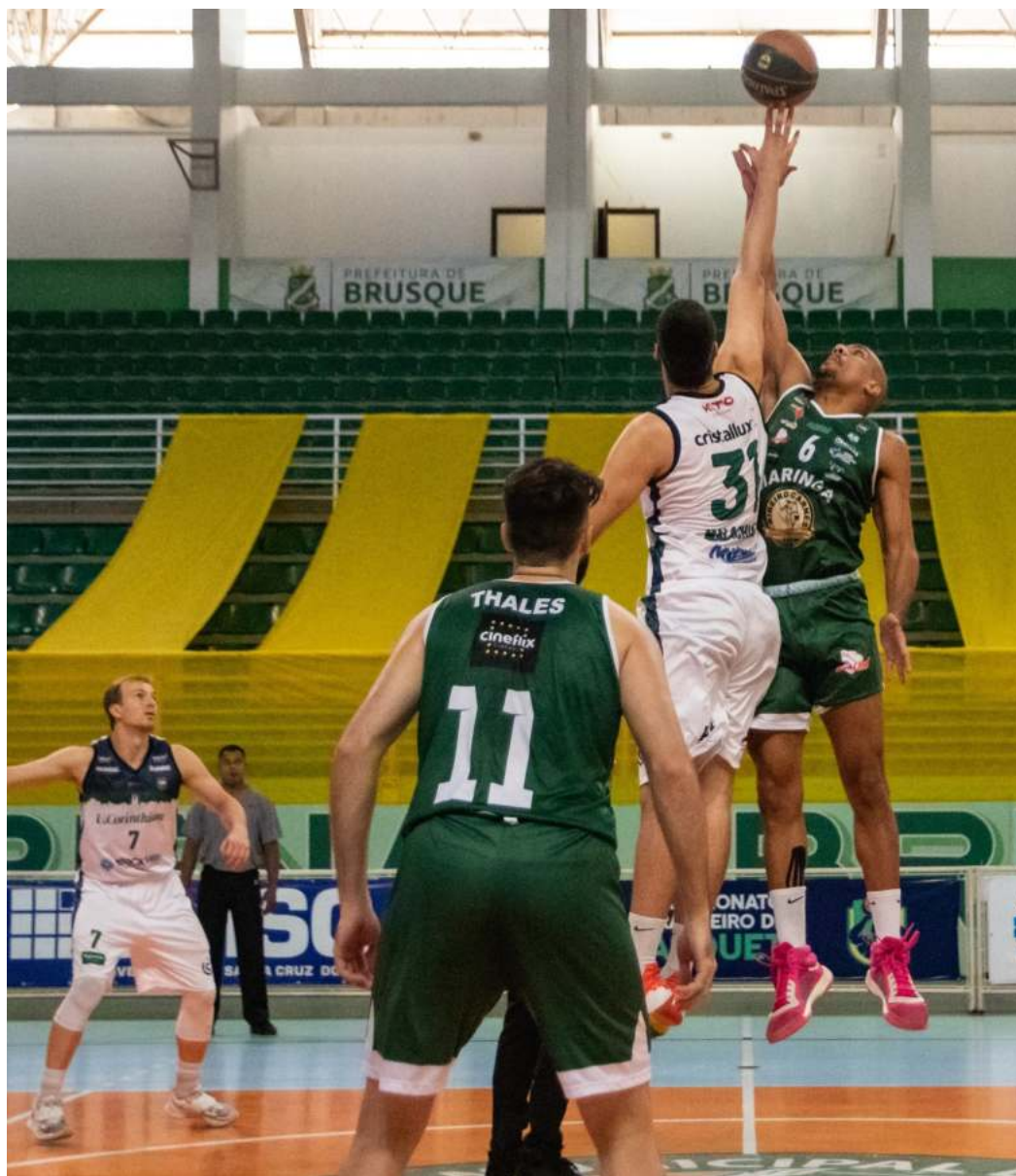
Malachias (31) retornou ao basquete no Brasileirão da CBB