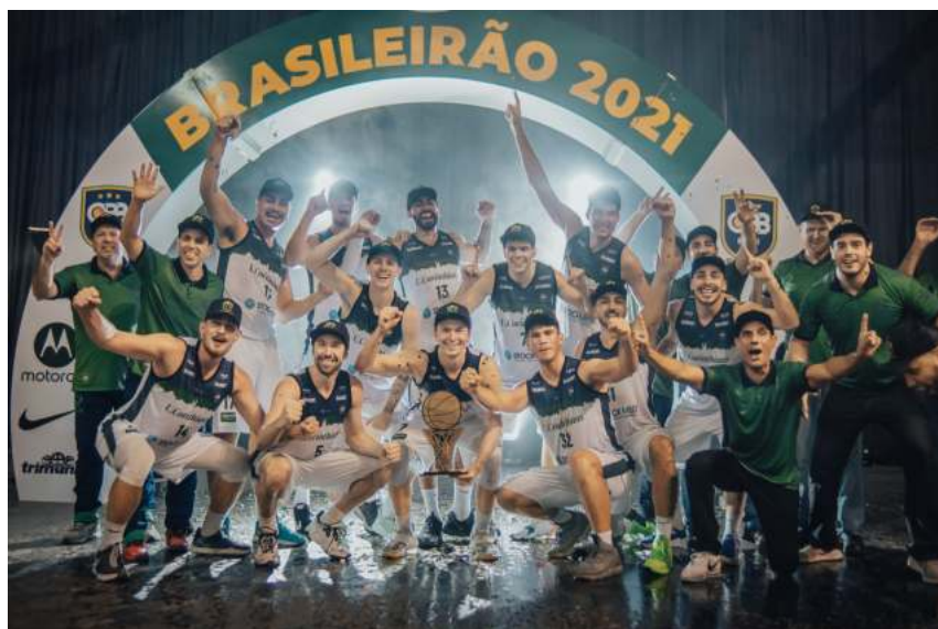
Stock Med/União Corinthians retornou ao cenário nacional com título