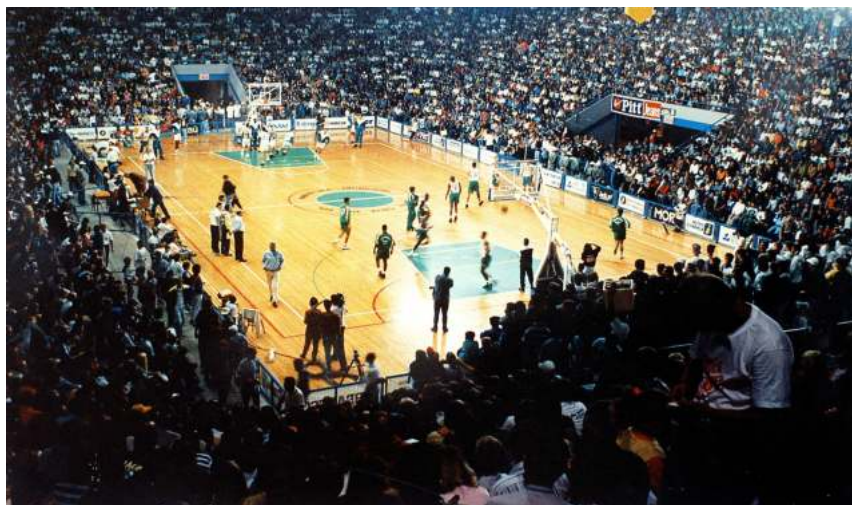
Ginásio Poliesportivo foi construído durante a fase áurea do Corinthians