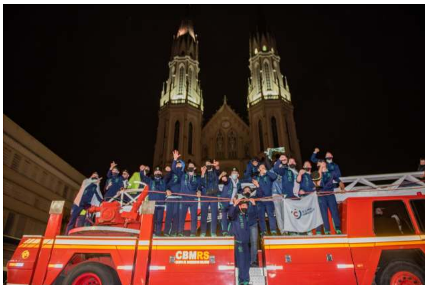
UniCo voltou a desfilar em Santa Cruz no caminhão do Corpo de Bombeiros