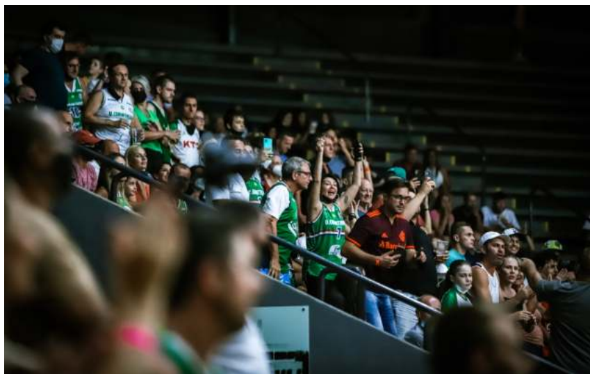
Torcida voltou a ver jogos de primeira divisão no Arnão