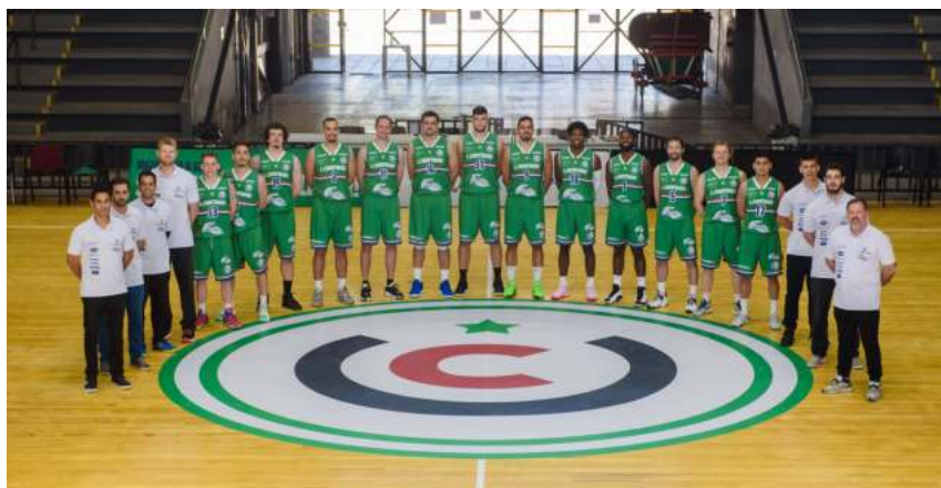
Elenco do Luvix/União Corinthians na estreia no NBB