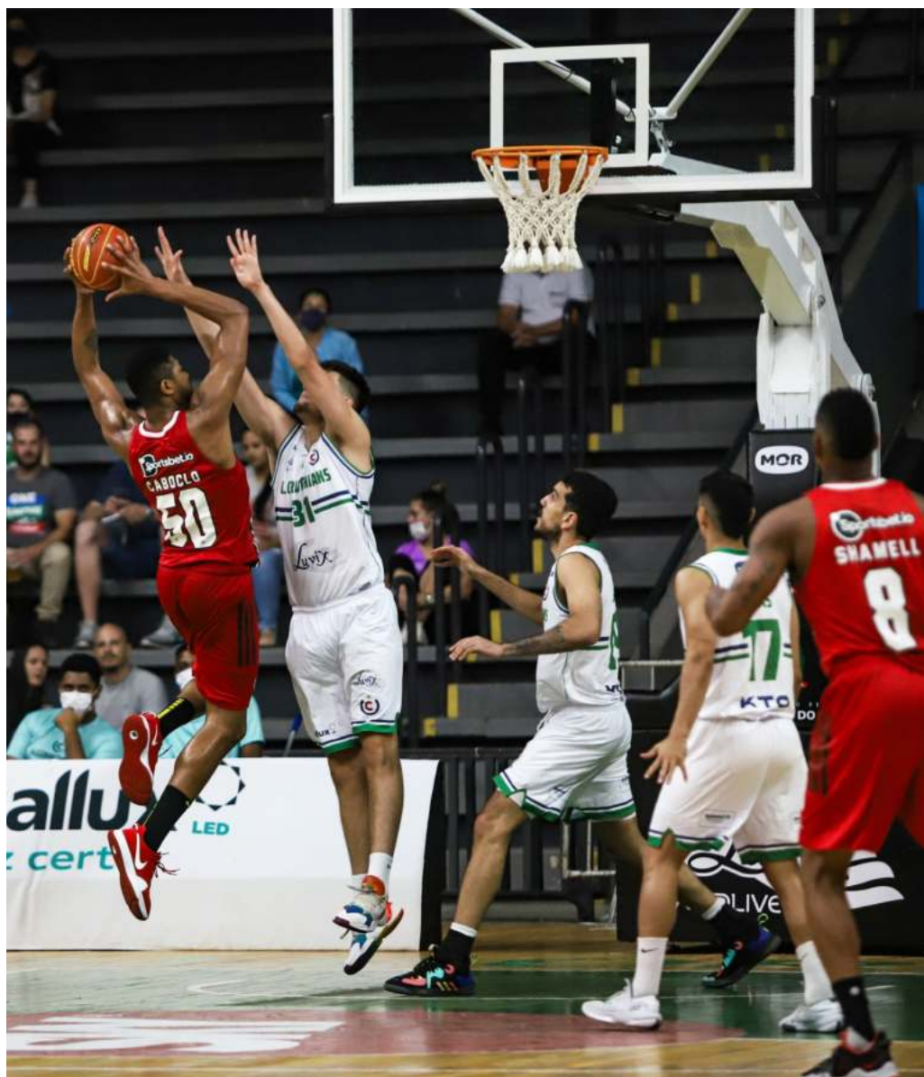
Ex-NBA, Caboclo tenta a cesta diante de Malachias