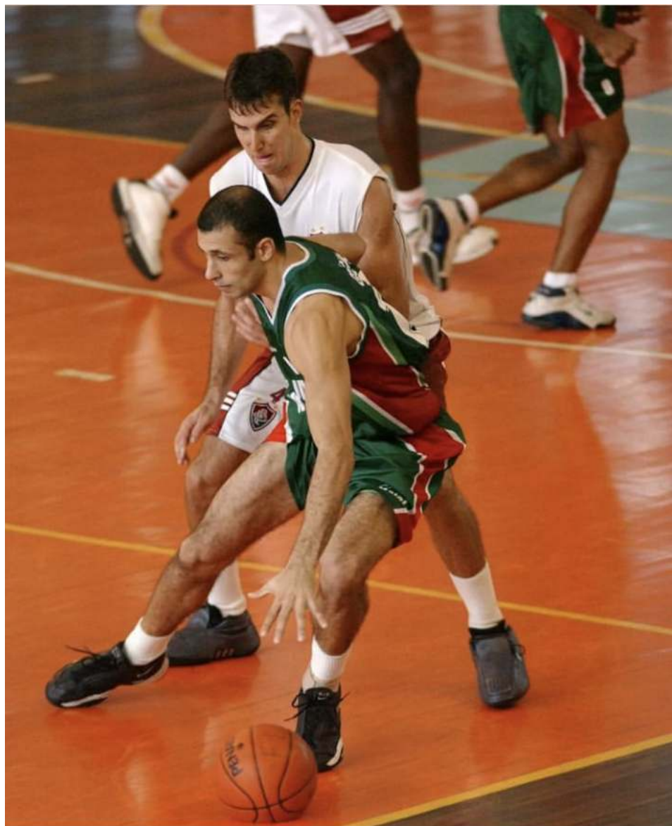
Gaúcho no Unisc/Corinthians/A.Zimmer durante a Liga Nacional de 2002