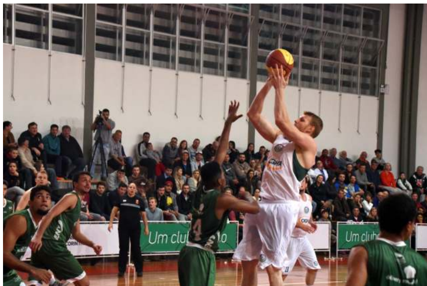
Projeto de retomada recolocou Santa Cruz no Estadual