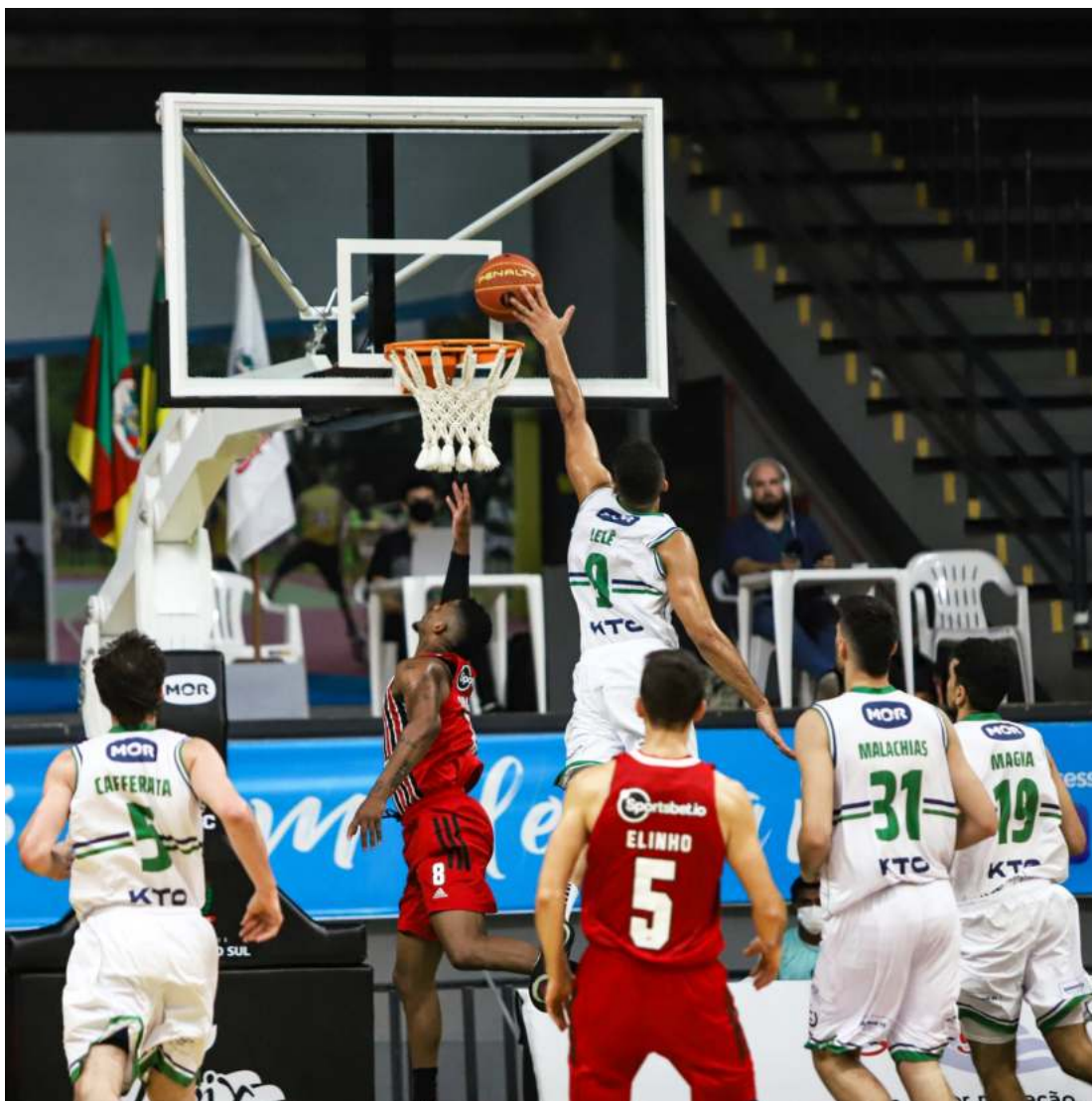
Luvix/União Corinthians derrotou o badalado São Paulo pelo NBB