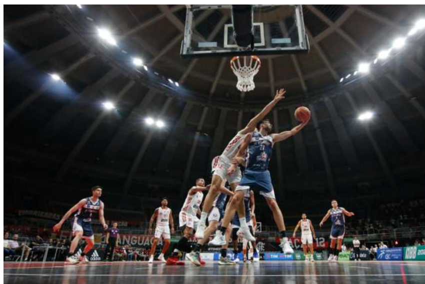
Agüerre (27) foi a principal contratação do UniCo para o NBB 15