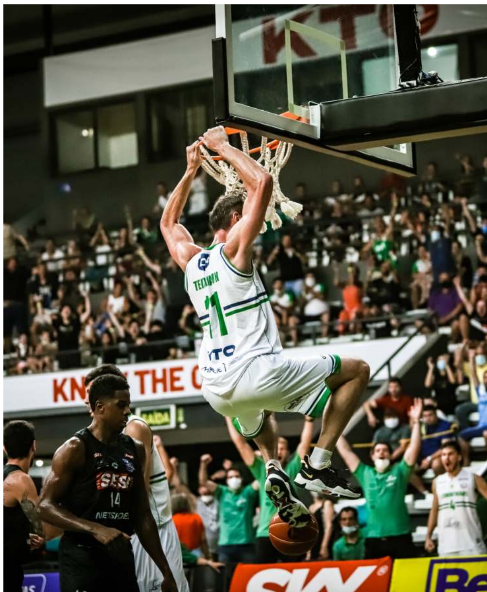
Teichmann foi decisivo para o UniCo derrubar o invicto Franca