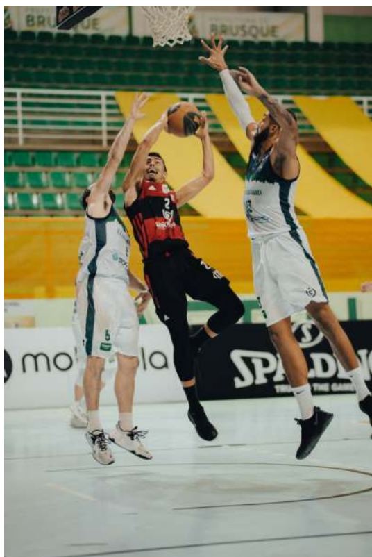
UniCo enfrentou o Flamengo/Blumenau na decisão do campeonato da CBB

– Eu amo a minha cidade. A gente quer mais. Próxima temporada tem mais.