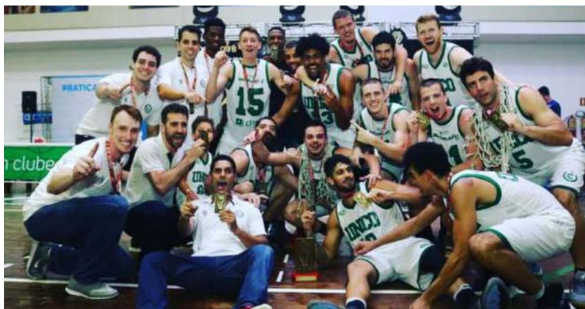
UniCo comemorou a reconquista do título estadual

– É uma emoção muito grande devolver este título à cidade – vibrou o técnico.