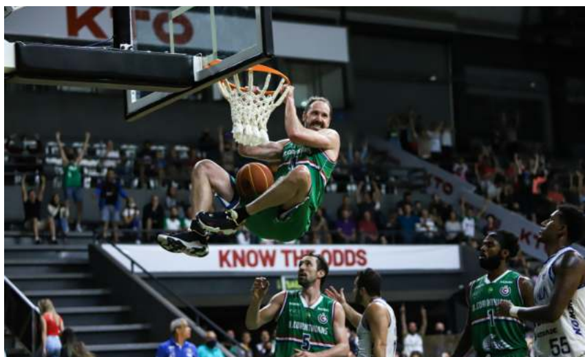
Teichmann manteve em casa o histórico de enterradas