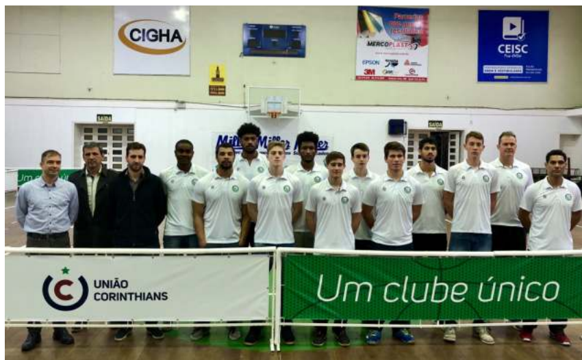
União Corinthians teve bom desempenho em torneios de categorias de base