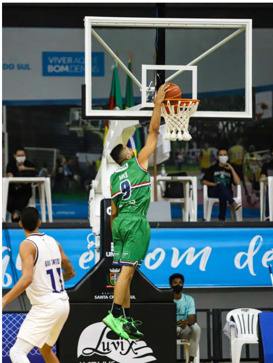
Lelê fez a última cesta do Brasileirão e a primeira do NBB