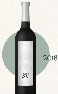
Casa Madero 3V