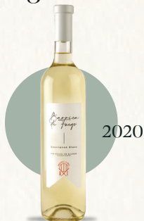
Barrica de Fuego Sauvignon Blanc