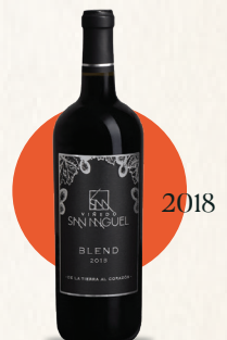
Bled Crianza Tinto