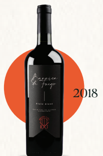
Barrica de Fuego Field Blend