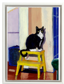
Matilda Höög Lil' Shithead 2023 46 x 34 cm Olje på lerret 9.200 NOK