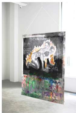
Julie Ebbing Cerberus 2023 115 x 96 cm Blekk, akryl, olje og spraylakk på frittstående tekstil 35.000 NOK

Operagata 63A 0194 Oslo contact@koskoslo.no www.koskoslo.no @kosk_oslo