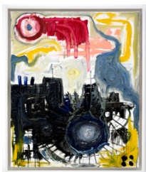
Kim André Hagen Ochtagon 2018 64 x 54 cm Olje på lerret 35.000 NOK