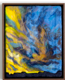
Matilda Höög Combustion 2023 66 x 51,5 cm Nålefilting, isopor 15.750 NOK