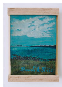
Bendik Riis Landskap i sol 1962 13,2 x 17,8 cm Olje på plate Guttormsgaards Arkiv