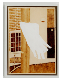
Matilda Höög Ledtråd 2020 33 x 24 cm Pyrografi (svipenn på finér) 7.000 NOK