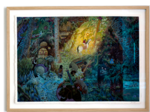
Bella Fasmer Bakholdsangrepet 2023 88,5 x 119,5 cm med ramme Tegning og ulike teknikker 20.000 NOK med ramme