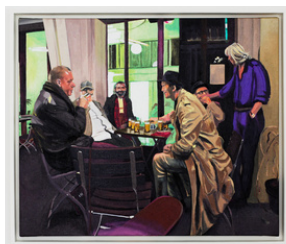
Matilda Höög Usual Suspects (Huset) 2018 56 x 66 cm Olje på lerret 14.800 NOK