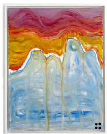
Kim André Hagen Uten tittel 2018 84 x 64 cm Olje på lerret 40.000 NOK