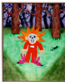
Tyler Metzger Twilight Castle 2022 103 x 83 cm Oljemaling og airbrush med akrylblekk på lerret 14.500 NOK