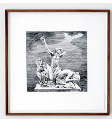
Johannes Høie Monument 2021 52 x 50,5 cm Blekk på papir 15.000 NOK med ramme