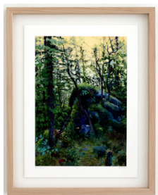
Bella Fasmer Mystisk skog 2022 75 x 52 cm med ramme Håndkolorert DGA, opplag 2/30 5.750 NOK med ramme 2.750 NOK uten ramme