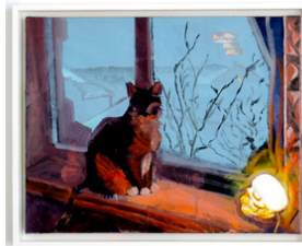
Matilda Höög Memento Mori 2020 40 x 50 cm Olje på lerret 10.700 NOK