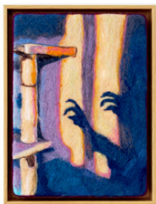
Matilda Höög Scratch Post 2023 42 x 33 cm Nålefilting, isopor 13.550 NOK