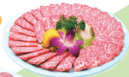
4. 上カルビ 3 Orders