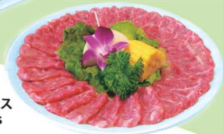
5. 上ロース 3 Orders