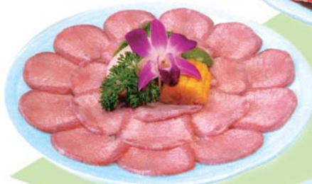
3. 上タン塩 3 Orders