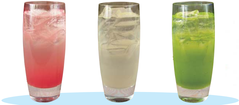
Peach Lychee Green Apple

Available • without Alcohol • with Soda $4.00