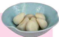
生ガーリック Whole Garlic 5.00