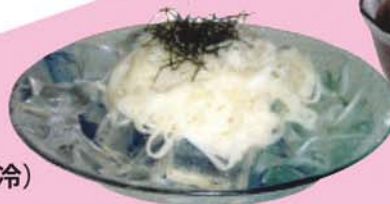
40. 稲庭うどん (冷)