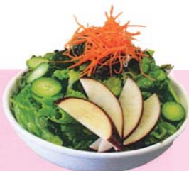
33. アンジン海藻サラダ